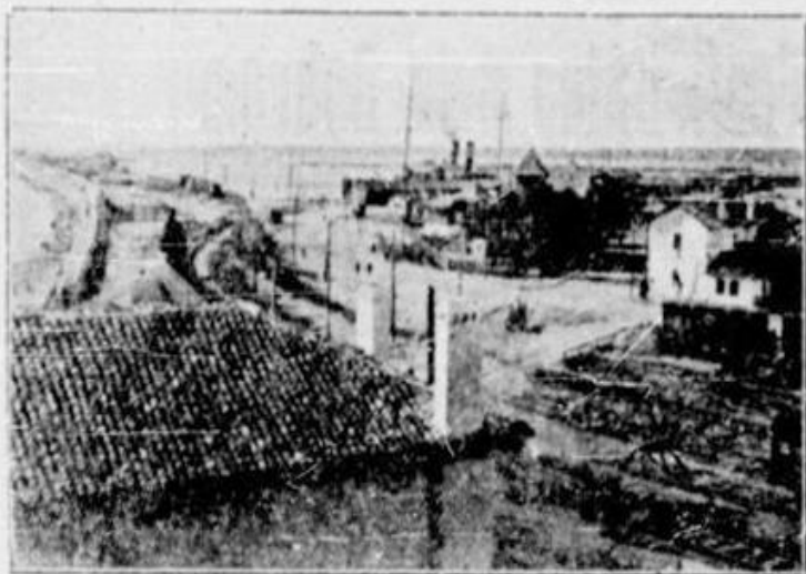
Portul acum 30 de ani